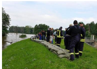
(FWW TU Kaiserslautern)