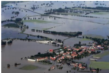
(FWW TU Kaiserslautern)

eine Weiterbildung für die Untere Führungsebene der Feuerwehr- und Katastrophenschutzeinheiten (6 Wochen)