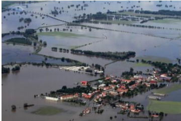
(FWW TU Kaiserslautern)

eine Weiterbildung für die Untere Führungsebene der Feuerwehr- und Katastrophenschutzeinheiten (6 Wochen)