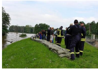
(FWW TU Kaiserslautern)